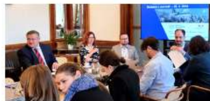
Screening je klíč k časnému odhalení nemoci. Účinná léčba