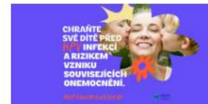
4. března, Mezinárodní den