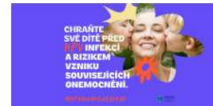
4. března, Mezinárodní den