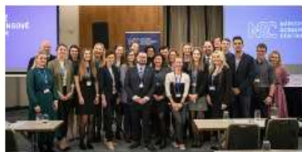
Zpravodaj 23: Stále pracujeme

spolupráce s občany a institucemi s cílem zlepšení zdraví celé společnosti