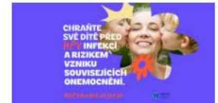
4. března, Mezinárodní den